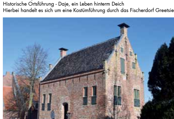
Steinhaus Greetsiel, Kleinbahnstraße 1, 26736 Greetsiel

Donnerstag, 12. Oktober, 14:00 - 15:00 Uhr Historische Ortsführung - Daje, ein Leben hinterm Deich Hierbei handelt es sich um eine Kostümführung durch das Fischerdorf Greetsiel.